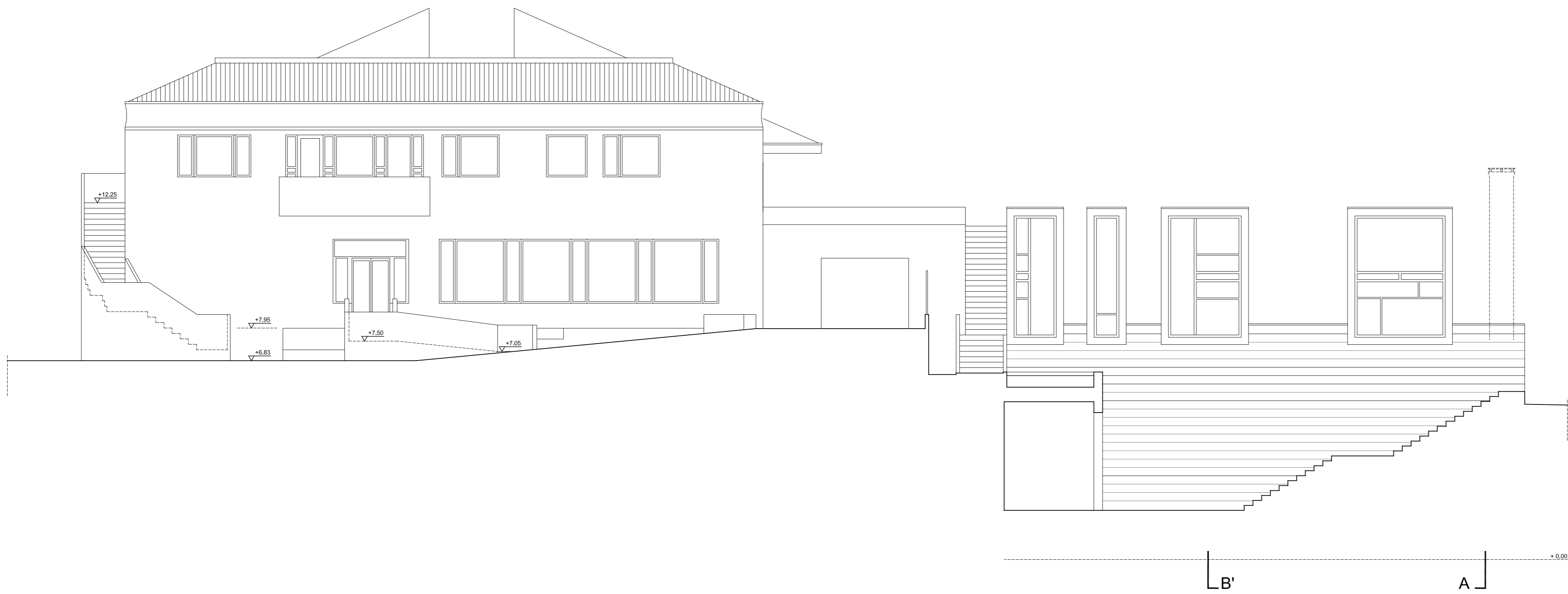
PROSPETTO POSTERIORE SUD-OVEST (SEZ. D-D') scala 1:100